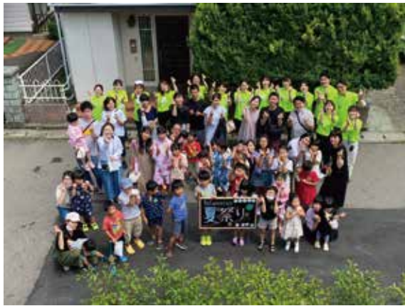
参加者のみなさんと集合写真

外では美味しい焼きそばとフランクフルトのお振る舞いやスイカ割りをしてお腹を満たし、半日があつ