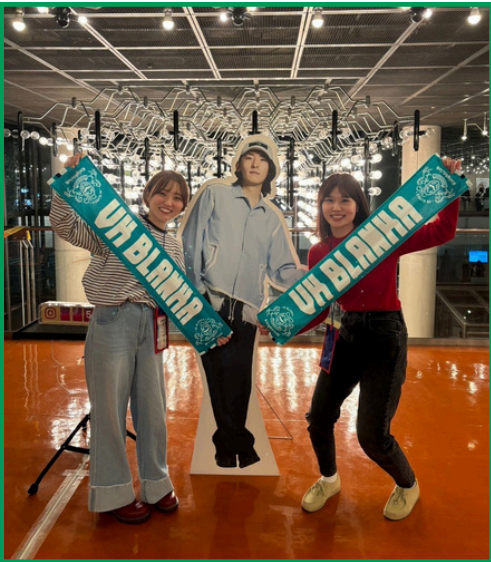
等身大パネルとパチリ📷 ピッケブランカ最高!